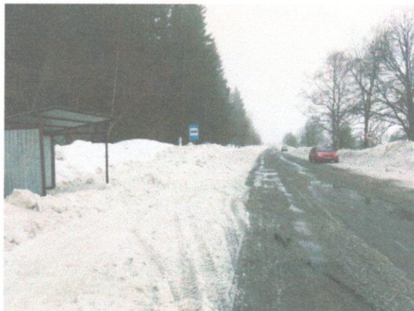
Состояние пункта посадки – высадки обучающихся МОУ СОШ п. Салми в д. Киркиекки на 20.03.2019